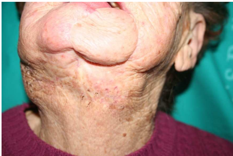
Figura 4. Paziente a sedici mesi di follow-up: buon controllo locale di malattia.